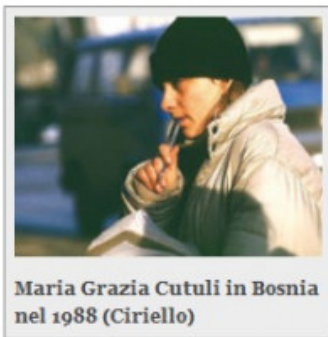
Maria Grazia Cutuli in Bosnia nel 1988

Tre anni di ricerche, decine di interviste e un minuzioso lavoro di indagine. Il documentario «Maria Grazia Cutuli - Il prezzo della verità» ricostruisce con materiali inediti la vita privata, professionale e le circostanze dell'omicidio dell'inviata del Corriere della Sera,