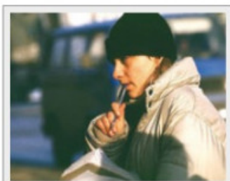
Maria Grazia Cutuli in Bosnia nel 1988

Tre anni di ricerche, decine di interviste e un minuzioso lavoro di indagine. Il documentario «Maria Grazia Cutuli - Il prezzo della verità» ricostruisce con materiali inediti la vita privata, professionale e le circostanze dell'omicidio dell'inviata del Corriere della Sera,