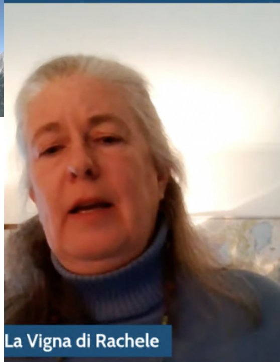
La Vigna di Rachele