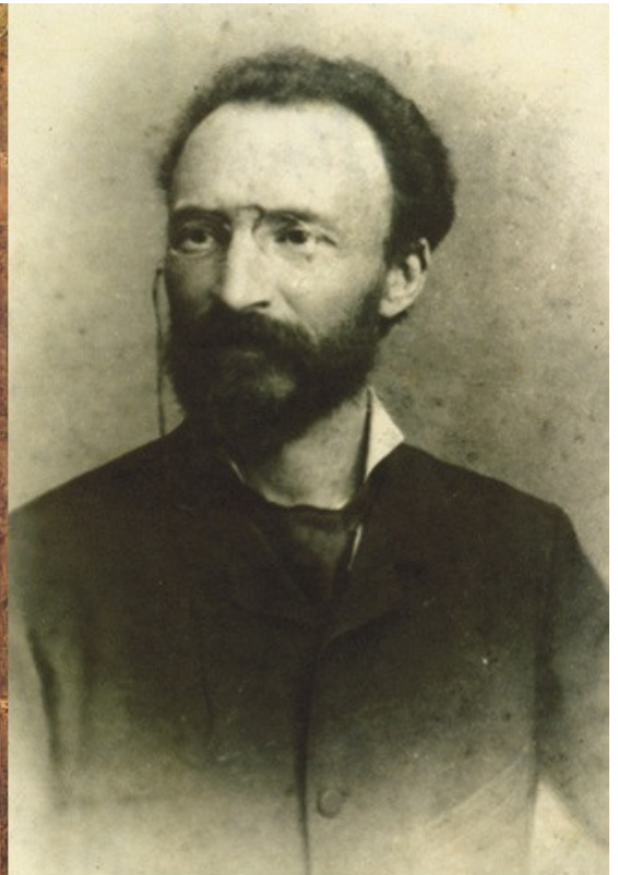
Bartolo Longo all'età di 35 anni

Grazie al via libera concesso da papa Francesco, lunedì 24 febbraio, al Dicastero delle Cause dei Santi, la strada verso la canonizzazione del beato Bartolo Longo (1841-1926) è ormai spianata. Come informa il sito dello stesso Dicastero , nell'iter speciale intrapreso per il fondatore del santuario della Madonna di Pompei, si è chiesta la dispensa dal riconoscimento formale del miracolo ordinariamente necessario per la canonizzazione,