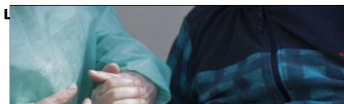
l'utilizzo di farmaci

Recentemente è stato pubblicato un lavoro in "preprint" in cui sono stati confrontati protocolli terapeutici con paracetamolo con altri che al posto di paracetamolo utilizzavano indometacina, un comune antiinfiammatorio non steroideo. I pazienti che hanno ricevuto indometacina hanno avuto un sollievo sintomatico più rapido rispetto a quelli con paracetamolo, con la maggior parte dei sintomi scomparsi nella metà del tempo. Nel gruppo indometacina, nessuno dei pazienti ha sviluppato desaturazione di ossigeno, mentre 20 dei 107 pazienti nel gruppo del paracetamolo hanno avuto desaturazione. Analoghi risultati sono stati riportati da uno studio appena pubblicato in "preprint" da ricercatori tra cui alcuni dell' Istituto di ricerche Mario Negri .